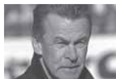
Ottmar Hitzfeld Fussballtrainer