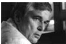
Ulrich Tilgner Nahost-Korrespondent ZDF und SF DRS